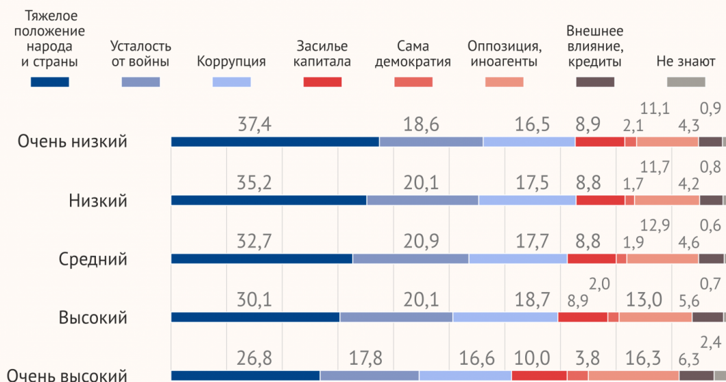
Рис. 8. Распределение однонаправленных ответов на вопрос № 4 «Каковы причины революций 1917 года в Российской Империи, как Вы считаете?», в зависимости от уровня доходов респондентов, %

3. Рассмотрите график, представляющий собой итоги опроса ИА «Регнум», посвящённого причинам Октябрьской революции 1917 года, и ответьте на вопросы.